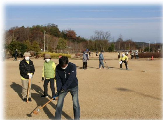
グラウンドゴルフ大会