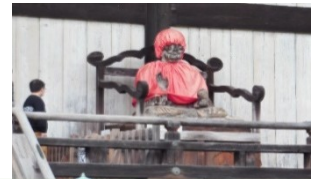
東賓頭盧尊者像（びんずるそんじゃぞう）

東大寺には「華嚴経」という大事な教えのほかに見るべきものも多い。国宝の「盧舎那大仏（るしゃなだいぶつ）（本尊）」の左隣に鎮座する「虚空蔵菩薩」は、認知症予防に「霊験あらたか」との説明があったので、老学生は真剣な表情で「100歳まで認知症にならないように。」と願いを込めてお参りをした。大仏殿の外廊下には、赤い衣服をまとった仏さんが鎮