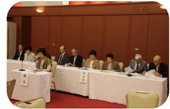
議案を審議中の総会