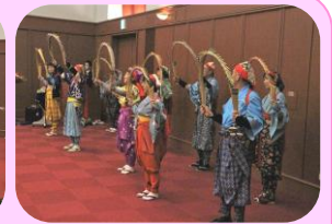
会場を盛り上げる民謡踊りと大道芸のアクション