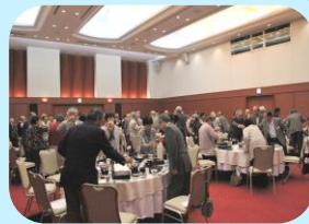
話に花が咲く学友会らしいっぱいの懇親会風景